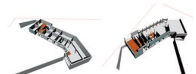
© ARKADE - Schwarzenberg (A) - 2001