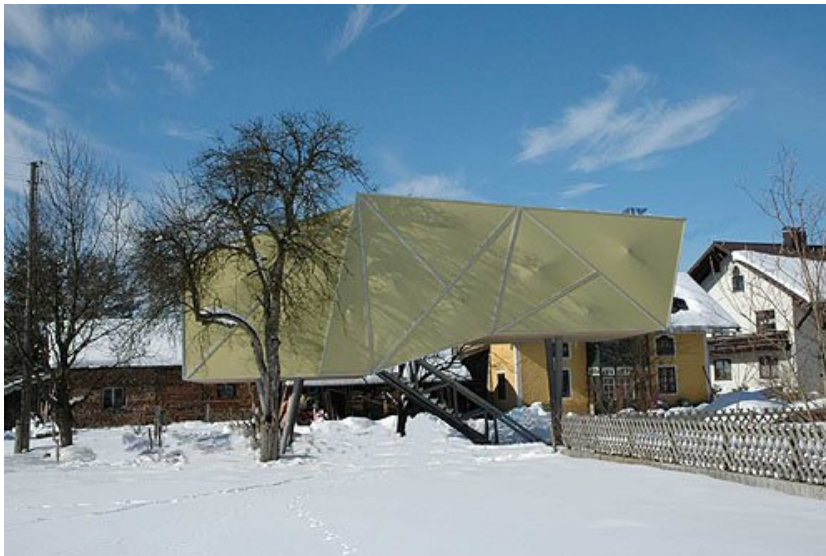
© Johannes Ebner, Franz Grömer - Lochen (A) - 2005