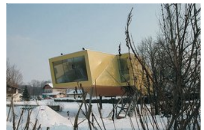
© Johannes Ebner, Franz Grömer - Lochen (A) - 2005