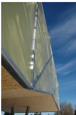
© Johannes Ebner, Franz Grömer - Lochen (A) - 2005