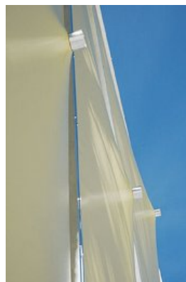
© Johannes Ebner, Franz Grömer - Lochen (A) - 2005