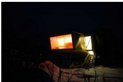
© Johannes Ebner, Franz Grömer - Lochen (A) - 2005