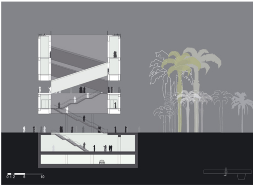
SECTION AT ATRIUM