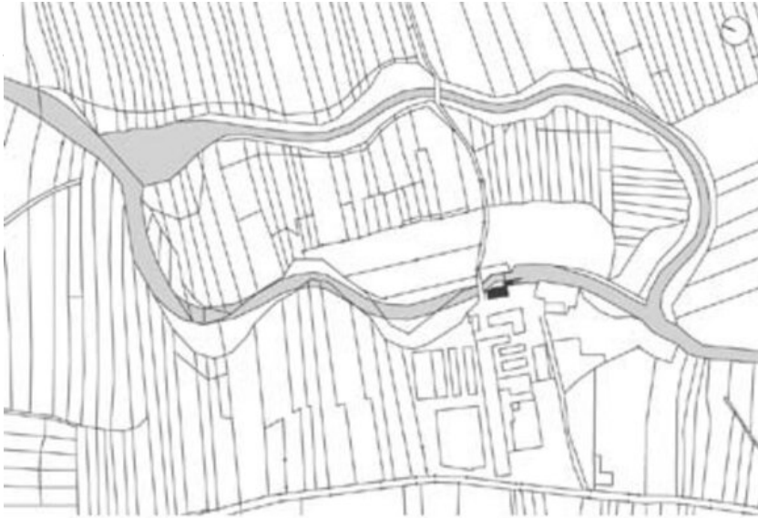
Kraftwerk an der Feistritz