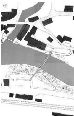
© Marcel Meili, Markus Peter Architekten

Fertigungstechnisch kam die von Anton Kaufmann eingeführte Nagelpressleimung zur Erzeugung großer schichtverleimter Querschnitte zum Einsatz.