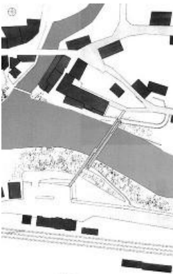
© Marcel Meili, Markus Peter Architekten

Fertigungstechnisch kam die von Anton Kaufmann eingeführte Nagelpressleimung zur Erzeugung großer schichtverleimter Querschnitte zum Einsatz.