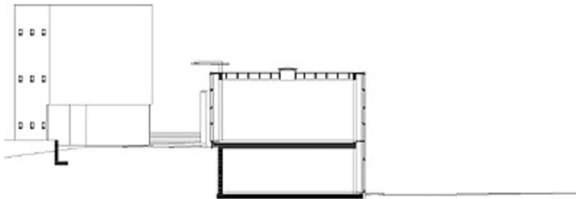
QUERSCHNITT – HALLE 1:200