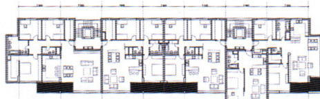
Pôdorys typického podlažia hrebeňovej zástavby