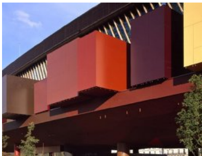
© Roland Halbe / ARTUR IMAGES

Reliquien-Fisch und Ahnenkult, Olga Grimm-Weissert, Der Standard, Mittwoch, 21. Juni 2006