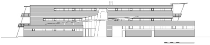
Ansichten Ost & West