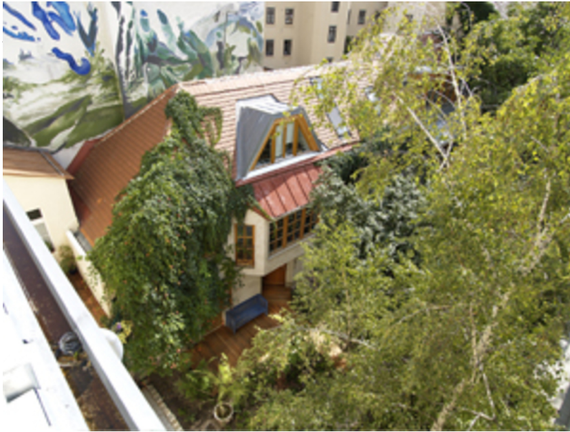
verdeckt - Intervention im Innenhof