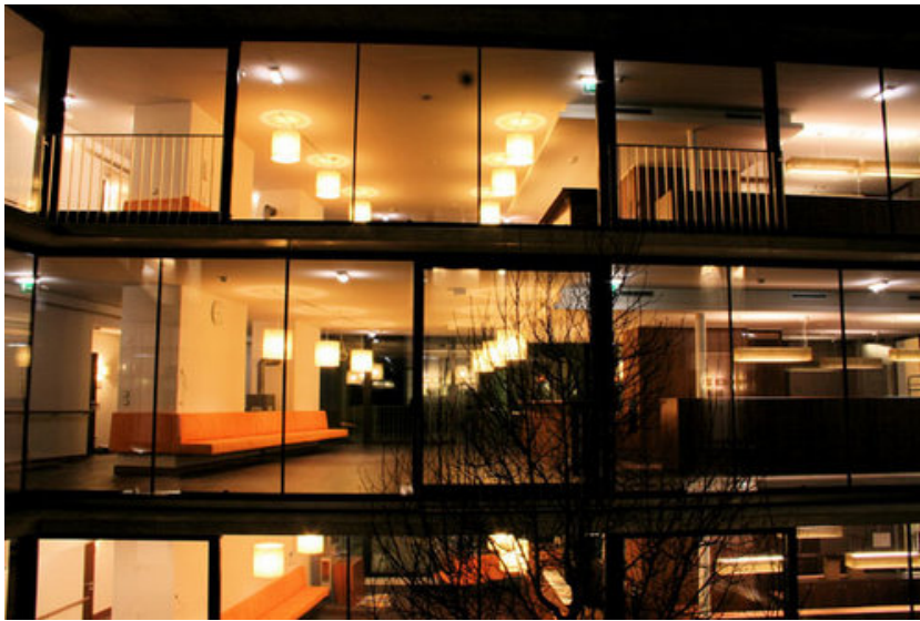
© lechner - lechner - schallhammer