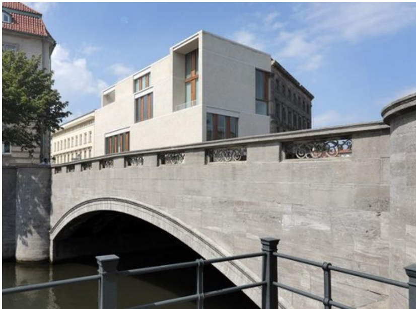
© Stefan Dauth / ARTUR IMAGES

Das Galeriehaus am Kupfergraben blickt vom Kupfergrabenkanal aus direkt auf Lustgarten und Museumsinsel. Hier im Zentrum der deutschen Hauptstadt schuf David Chipperfield ein modernes Gebäude, welches die Vergangenheit in sich trägt ohne sie jedoch zu replizieren.