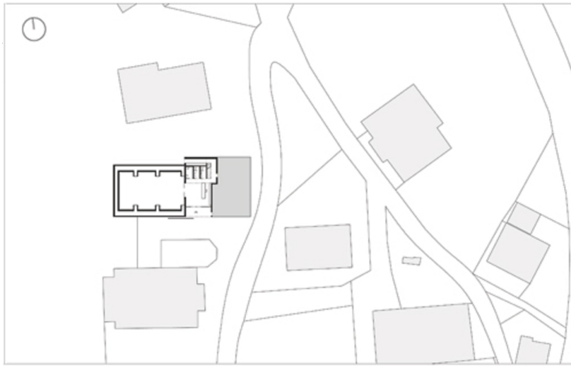
Angelika Kauffmann Museum