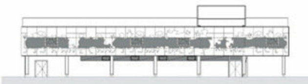
ANSICHT SÜD - WEST