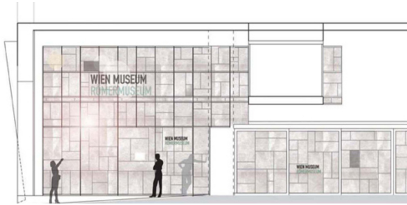
Wien Museum Römermuseum