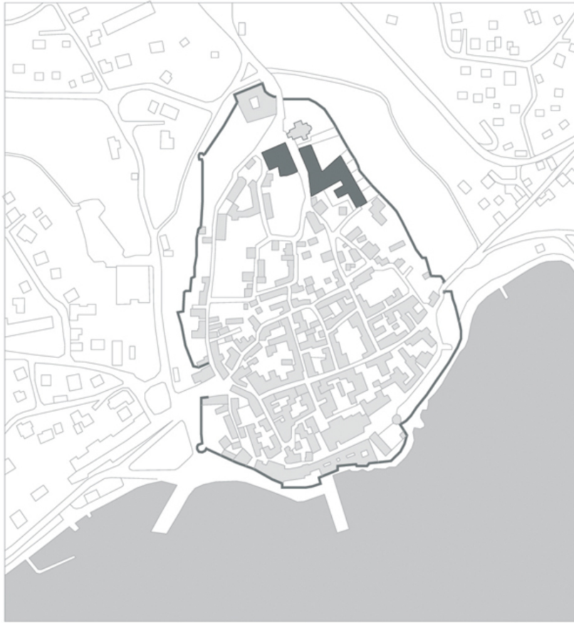
Grundschule „Krsto Frankopan“