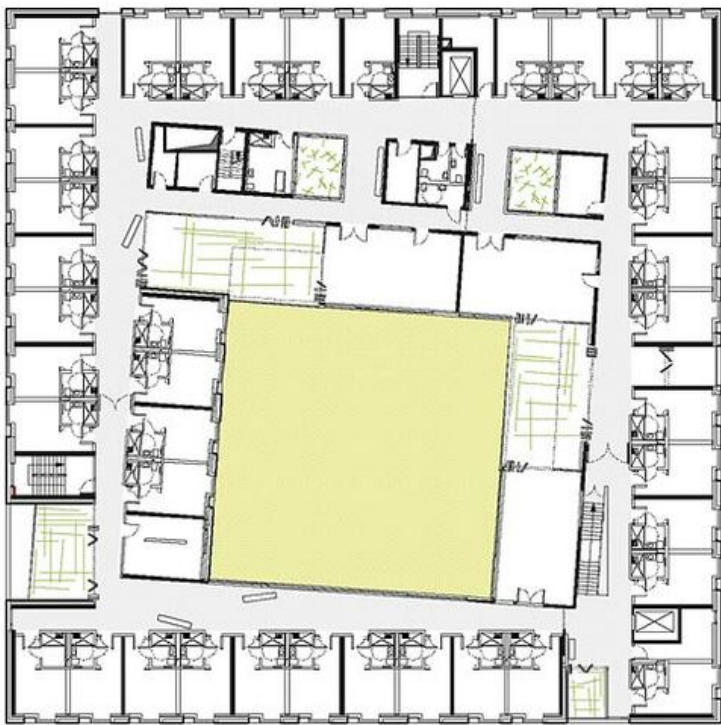
Grundriss EG, OG