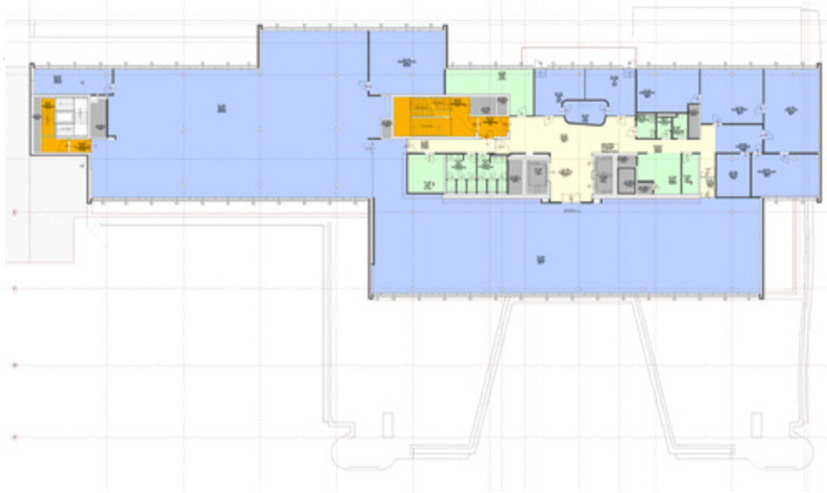
PVA - Erweiterung