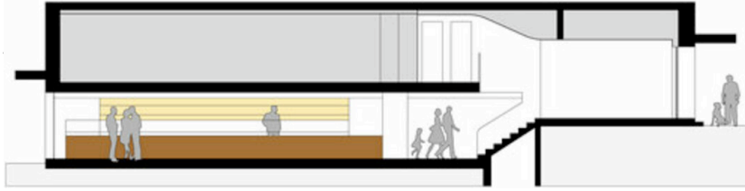
Bäckerei Café Kloser / Closer