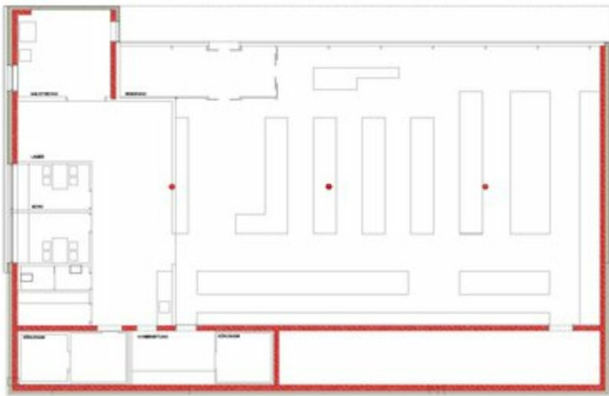
STOPP IN LANGENEGB - DORFLADEN