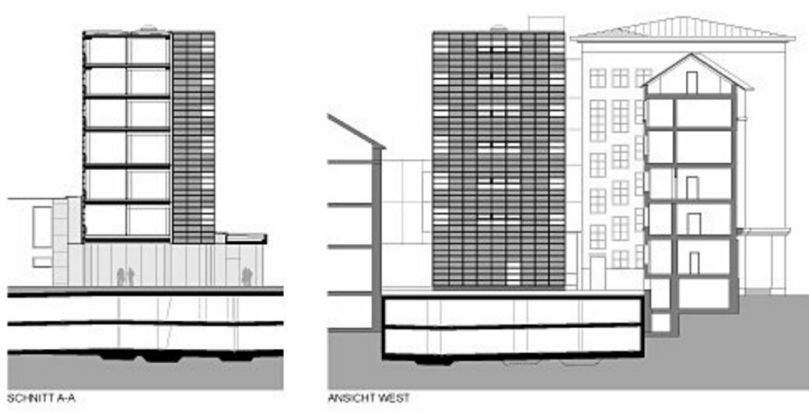
Schnitt Ansicht West