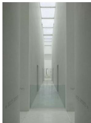
© Roland Halbe / ARTUR IMAGES