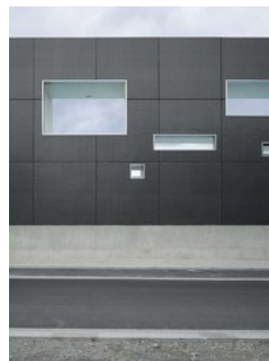
© Roland Halbe / ARTUR IMAGES