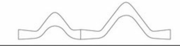
tatsächliche Innenlinie Aussenelement Abwicklung