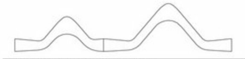
tatsächliche Aussenlinie Aussenelement Abwicklung