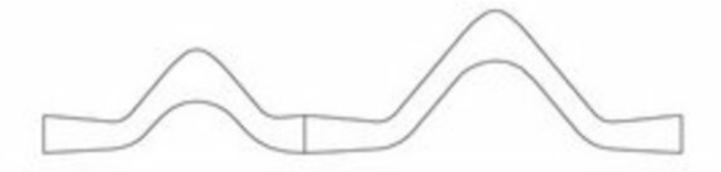
tatsächliche Aussenlinie Aussenelement Abwicklung