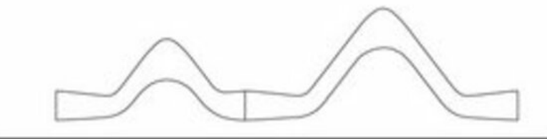
tatsächliche Innenlinie Aussenelement Abwicklung