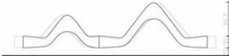
Tatsächliche Ansicht Aussenelement (verschnitten)