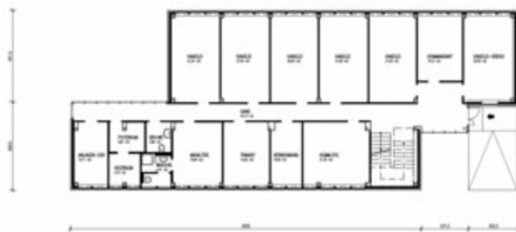
0 1 2 3 4 5 ERDGESCHOSS