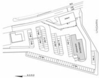
0 5 10 15 20 25 LAGEPLAN