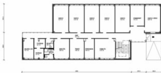
0 1 2 3 4 5 ERDGESCHOSS