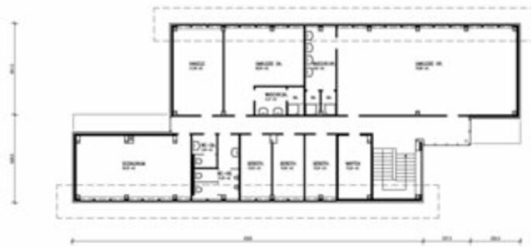
0 1 2 3 4 5 OBERGESCHOSS