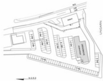
0 5 10 15 20 25 LAGEPLAN