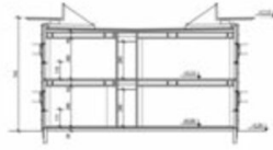
0 1 2 3 4 5 QUERSCHNITT