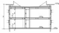
0 1 2 3 4 5 QUERSCHNITT