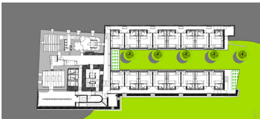
Grundriss UG, EG