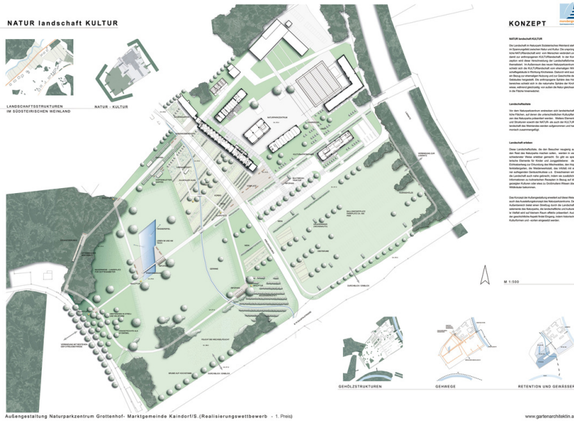
Außengestaltung Naturparkzentrum Grottenhof - Marktgemeinde Kaindorf/S. (Realisierungswettbewerb - 1. Platz)

KONZEPT NATUR landschaft KULTUR Das Landschafts- und Kulturlandschaftskonzept verbindet die Natur mit der Kultur und schafft ein Zentrum für die Region. Die Landschaft ist als ein zusammenhängendes Ganzes zu verstehen, das die Natur und die Kultur miteinander verbindet. Die Landschaft ist als ein zusammenhängendes Ganzes zu verstehen, das die Natur und die Kultur miteinander verbindet. Landschaftsstruktur Die Landschaftsstruktur verbindet die Natur mit der Kultur und schafft ein Zentrum für die Region. Die Landschaft ist als ein zusammenhängendes Ganzes zu verstehen, das die Natur und die Kultur miteinander verbindet. Landschaftsstruktur Die Landschaftsstruktur verbindet die Natur mit der Kultur und schafft ein Zentrum für die Region. Die Landschaft ist als ein zusammenhängendes Ganzes zu verstehen, das die Natur und die Kultur miteinander verbindet.