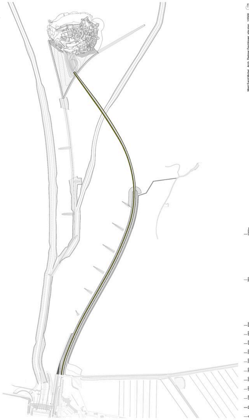
Mont Saint Michel - La Jetée