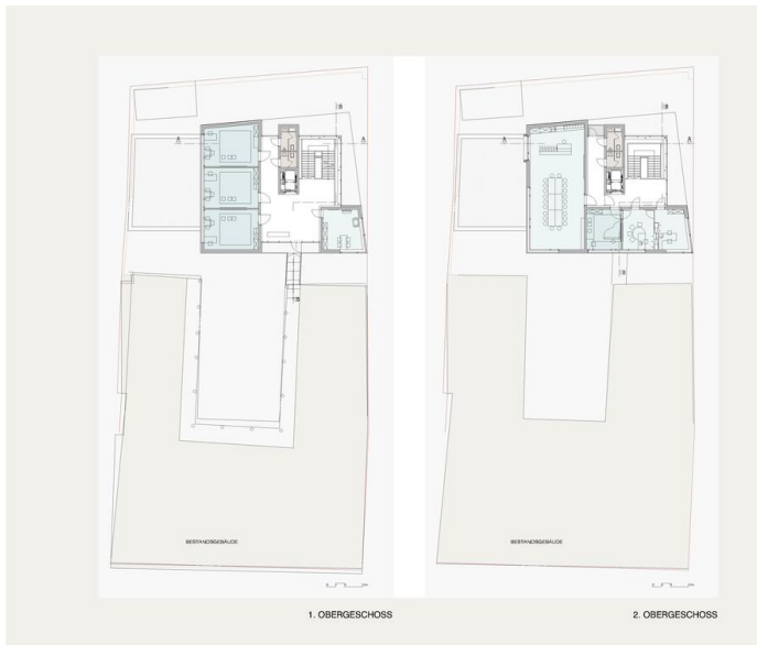
Grundriss OG1, OG2