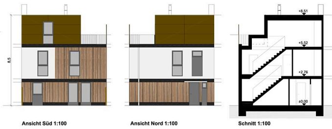
Ansicht Süd 1:100