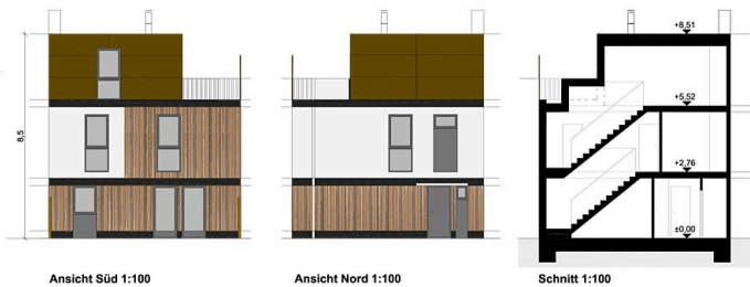
Ansicht Süd 1:100