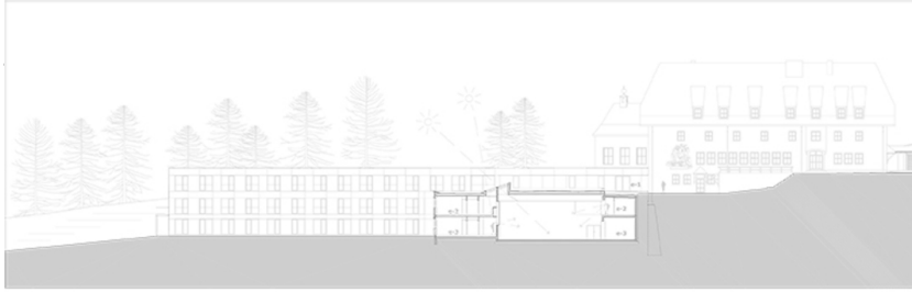
Landwirtschaftliche Fachschule Tamsweg