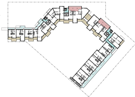
2.OG Grundriss gesamt