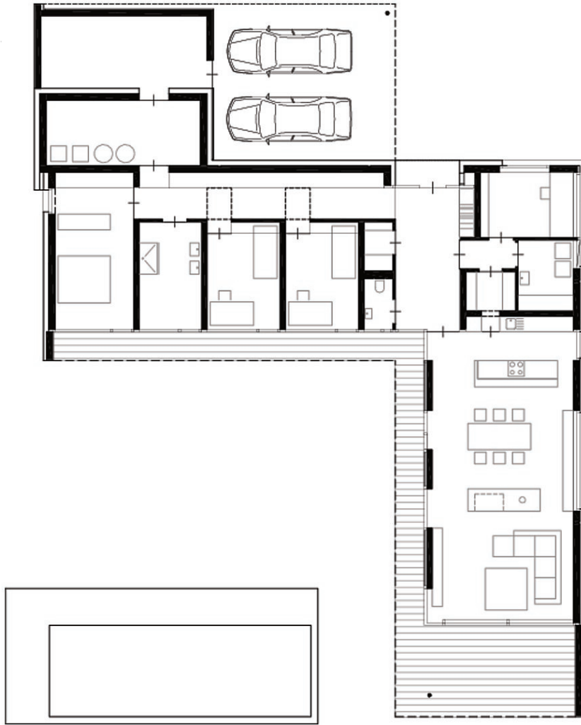
Grundriss Haus am Feld