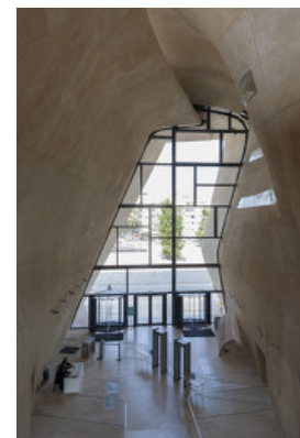
© Iñigo Bujedo-Aguirre / ARTUR IMAGES