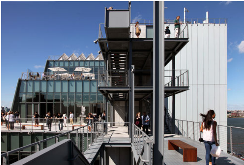
© Nic Lehoux / ARTUR IMAGES