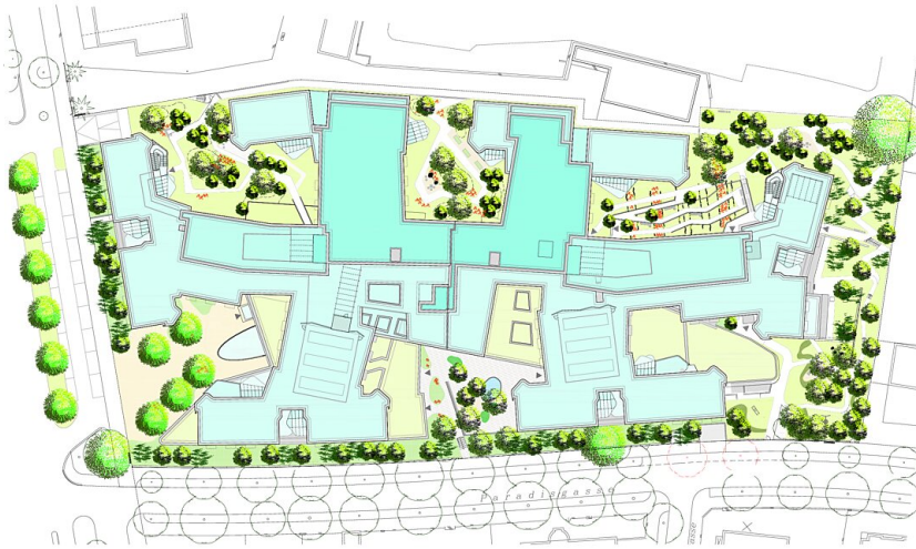
Lageplan M 1:500 Alle Dächer sind begrünte Dächer