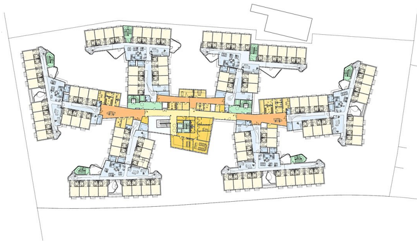
Grundriss Ebene 2-3 M 1:500