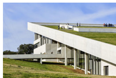
© Hufton &amp; Crow / ARTUR IMAGES