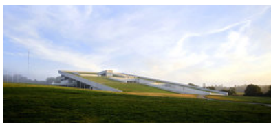
© Hufton &amp; Crow / ARTUR IMAGES