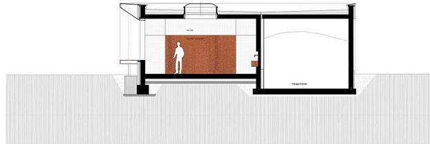
SCHNITT - Q