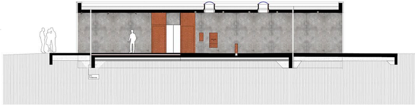
SCHNITT - L