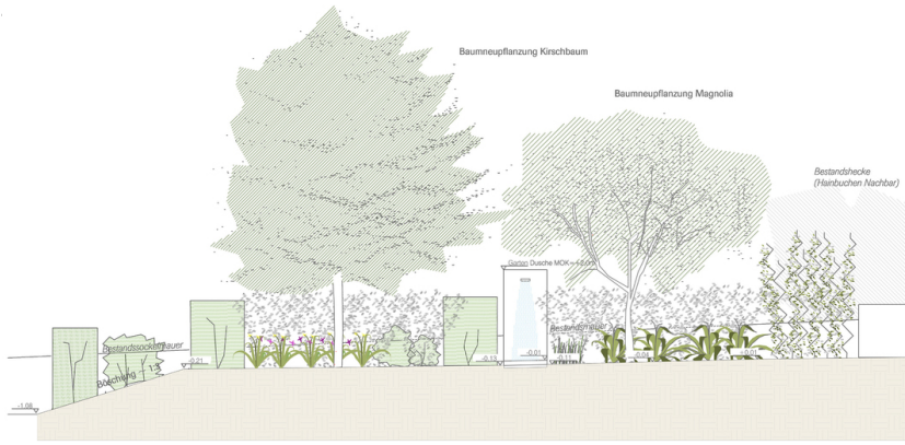
ANSCHLUSS SCHNITT 1 (NORD)