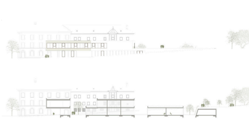
Tiroler Fachberufsschule für Garten, Raum und Mode - Zubau Werkstattengebäude