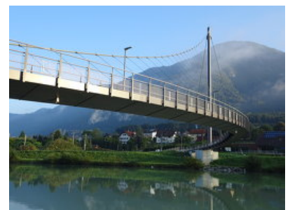
© Horn &amp; Partner ZT GmbH