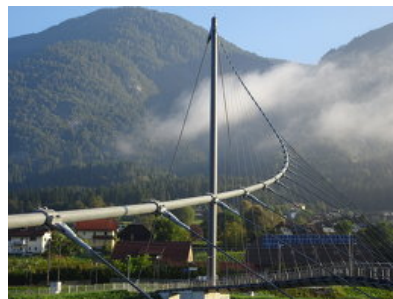
© Horn & Partner ZT GmbH