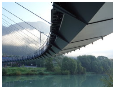
© Horn &amp; Partner ZT GmbH