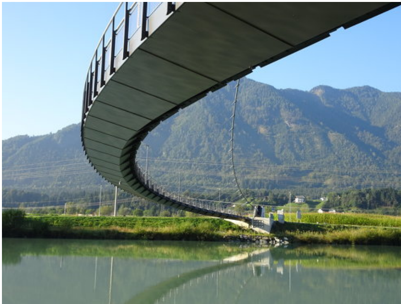
© Horn &amp; Partner ZT GmbH