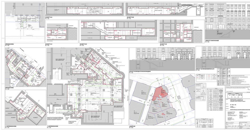
Lageplan, Grundrisse, Schnitte & Ansichten