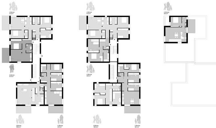
Grundriss DG | 1:200

BROT PRESSBAUM | 17.12.2018 | Haus 2 | Grundrisse EG | Grundrisse OG | M 1:200