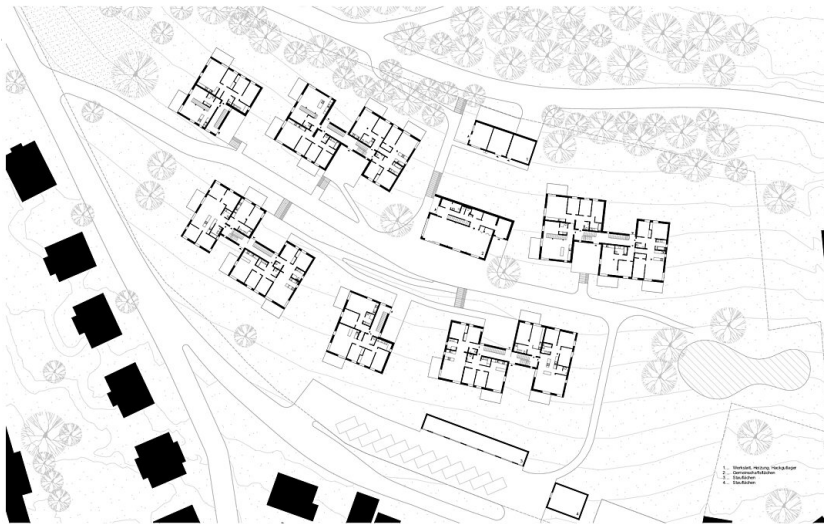
Grundrisse EG | 1:500

BROT PRESSBAUM | 17.12.2018 | Grundrisse EG | M 1:500