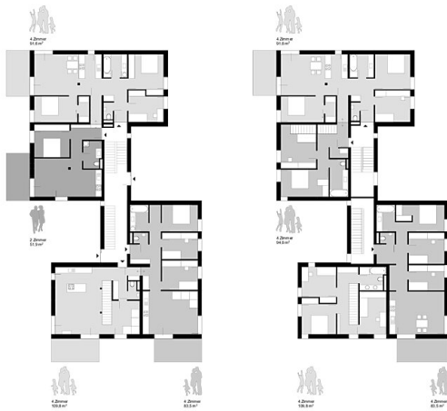
Grundrisse DG | 1:200

BROT PRESSBAUM | 17.12.2018 | Haus 2 | Grundrisse EG | Grundrisse OG | M 1:200