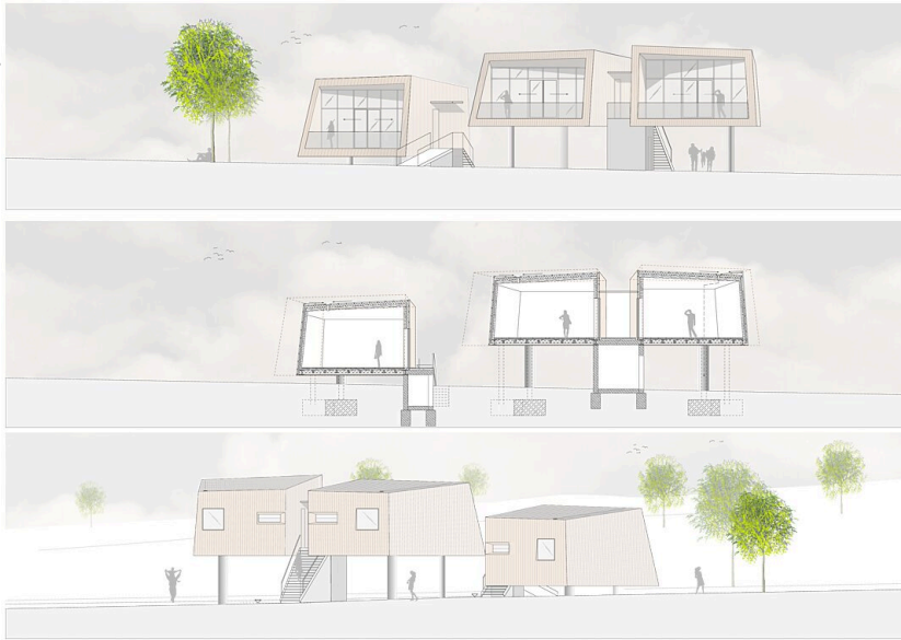
Schnitt & Ansichten