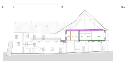
schnitt / ansicht ost