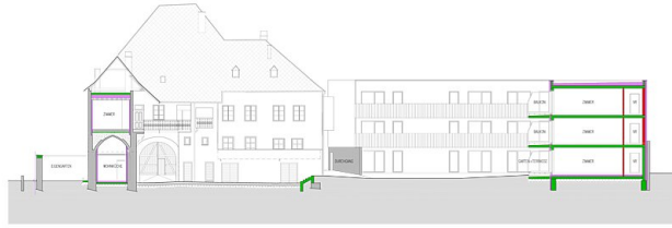
schnitt / ansicht süd