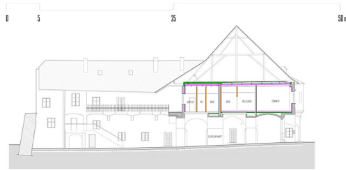
schnitt / ansicht ost