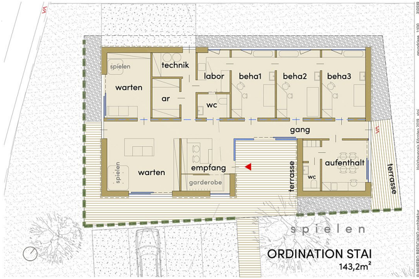
Stai Pub Nextroom