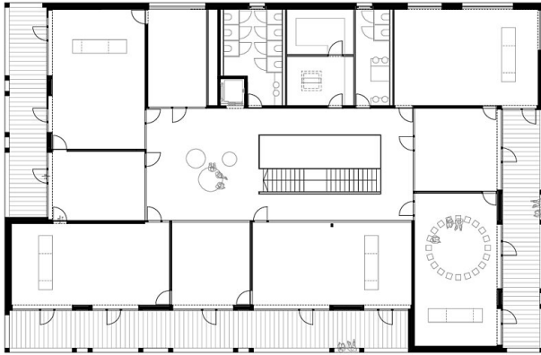
Grundriss OG + Schnitt