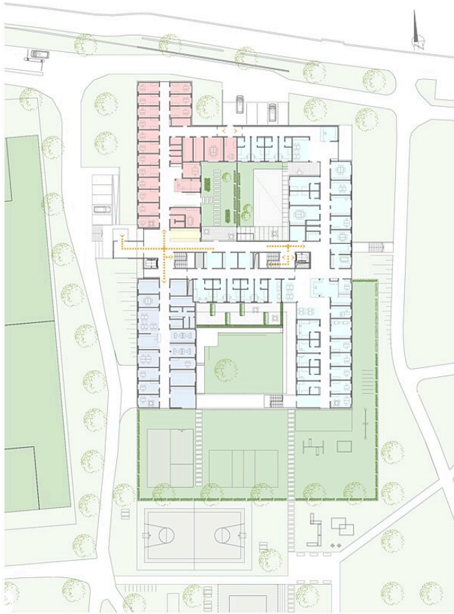
LKH Hall in Tirol - Kinder- und Jugendpsychiatrie Architekten Pontiller & Schweigg!