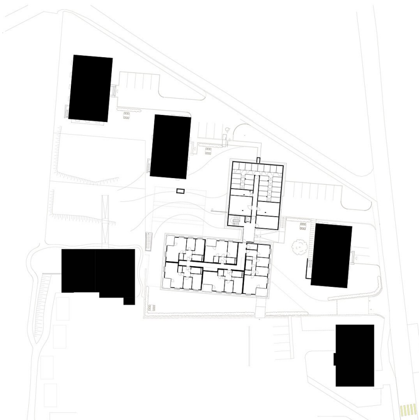
Grundriss EG Neubau