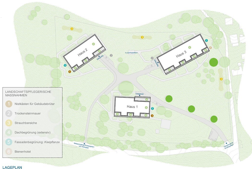
LAGEPLAN KINDERGARTEN PÖTZLEINSDORF