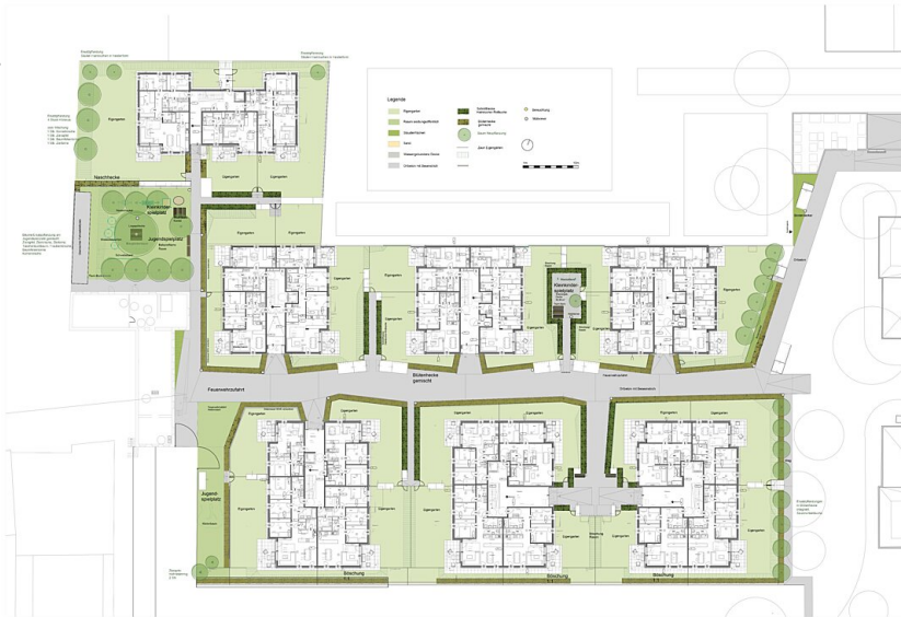
Mona Plan Nextland A1